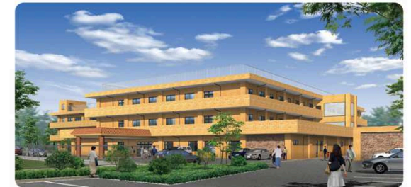
藤沢富士白苑完成予想パース ※図面を元にしたもので実際と異なる場合があります。